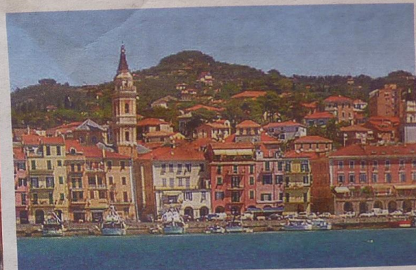
Calata Cuneo, uno dei luoghi di Imperia più visitati

simbolicamente le due città. Il calendario di iniziative organizzate dal Comune prevede i concerti della Camerata Musicale Ligure e del Coro Mongioje (Auditorium della Camera di Commercio) oltre a una serie di visite guidate nei luoghi più suggestivi e caratteristici di Imperia. A Villa Faravelli è stata allestita la mostra