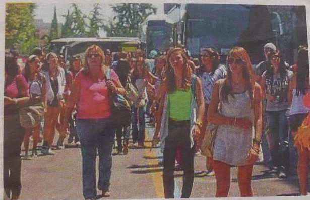
Turisti tedeschi, una storica risorsa per gli alberghi della riviera

I grillini hanno diffuso anche una lettera aperta con una postilla tradotta in tedesco e destinata alla delegazione di Friedrichshafen con la quale si scusano e spiegano le loro motivazioni. «Dove mai porteranno a spasso si chiedono i pentastellati i delegati tedeschi per evitare brutte