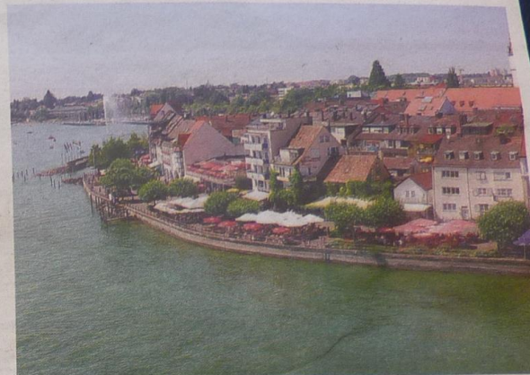
Friedrichshafen, città della riva settentrionale del lago di Costanza